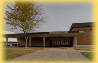
école Samuel-De Champlain 2740, ave Saint-David G1E 4K7