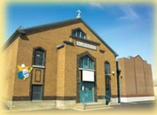
centre de loisirs Ulric-Turcotte 35, rue Vachon G1C 2V3