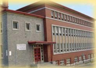
école de l'Harmonie (Saint-Édouard) 15, rue Saint-Edmond G1E 5C8