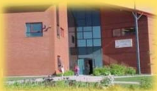
école des Cimes 250 rue Cambert G1B 3R8