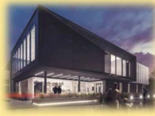
Centre communautaire des Chutes 4551, boul. Sainte-Anne G1C 2H8