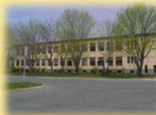
école de l'Harmonie (Monseigneur-Robert) 769, ave de l'Éducation G1E 1J2